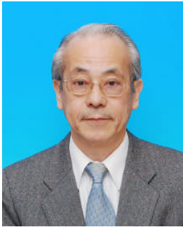
【筆者紹介】 高橋 貞三